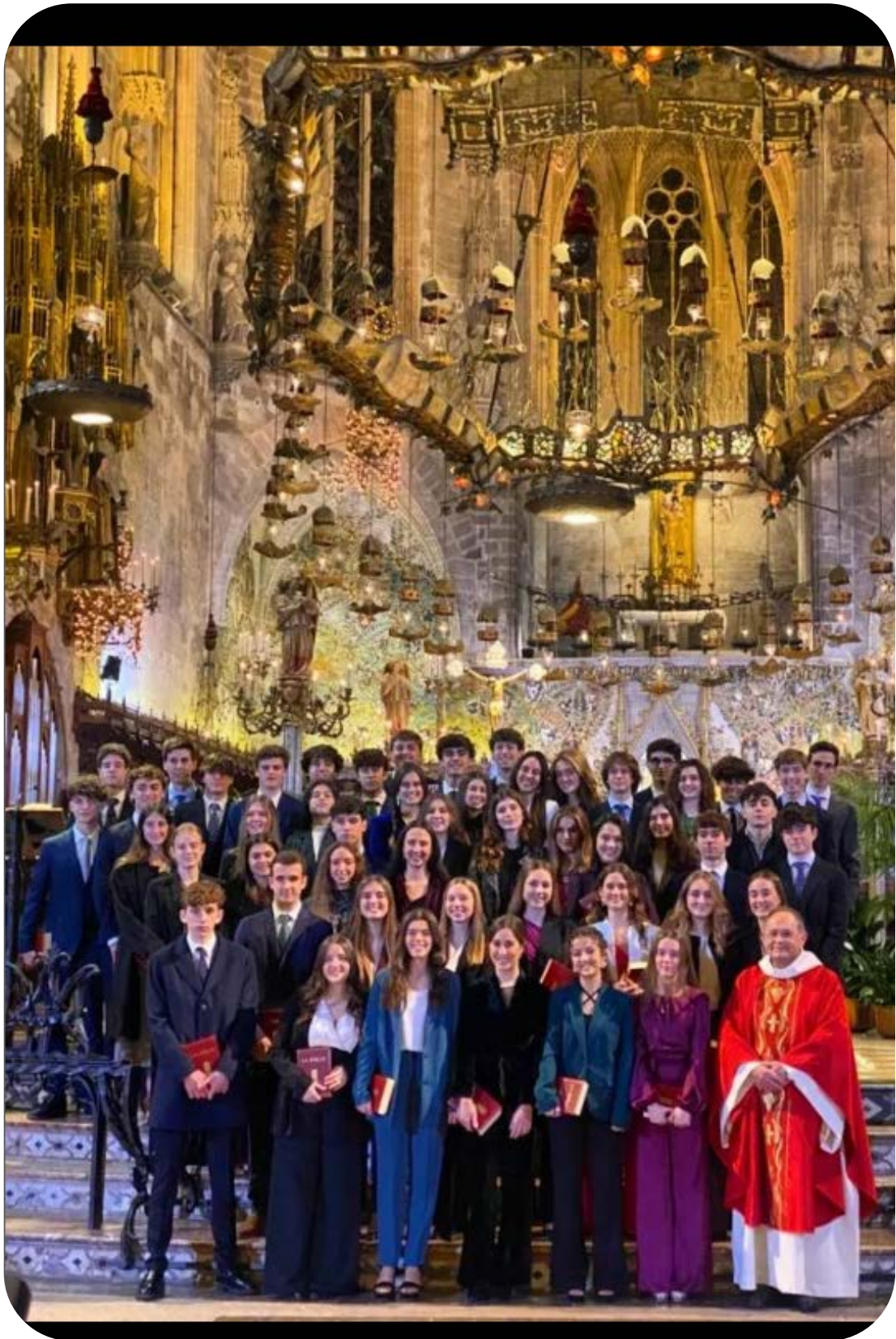
Emotiva confirmación de nuestro alumnado de 2º de Bachillerato, acompañados de sus familiares, amigos y profesores.