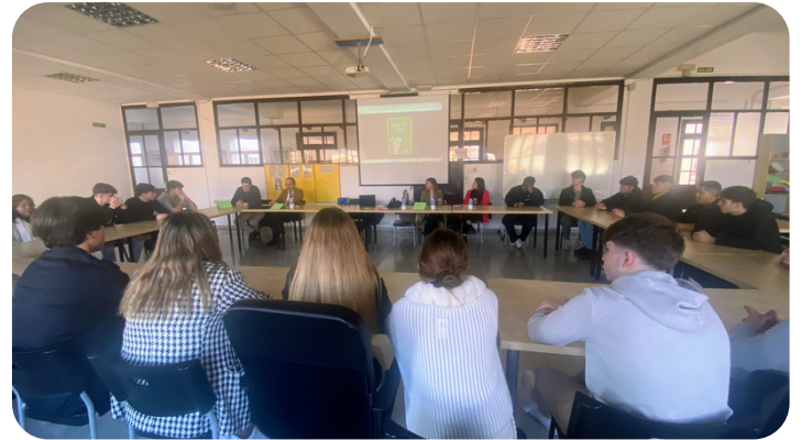
"Trío de Ases". Último proyecto MIRA para el alumnado de 2º de Gestión Administrativa. En esta ocasión, contamos con ex alumnas que ya se han integrado exitosamente al mundo laboral.