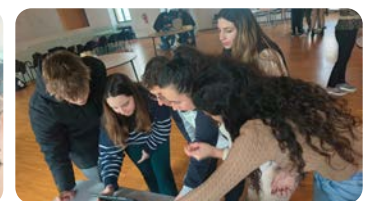
Escape Room para alumnado de Asistencia a la Dirección en Palma Activa: "Missió Ocupació". Primera acción que complementa la Actividad de Aprendizaje denominada "CAPACÍTATE".