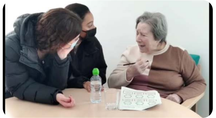
Emotiva e inspiradora visita del alumnado de 1º de Bachillerato al Llar d'ancians de Palma.