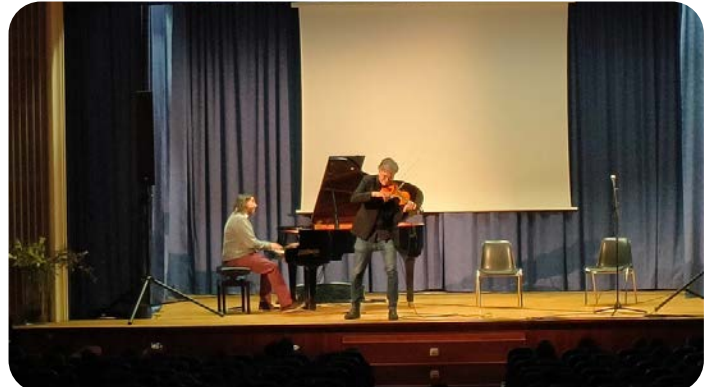
En la sede de Palma alumnado de Bachillerato y CCFF pudo disfrutar de un maravilloso y solidario concierto a cargo de la FUNDACION SIFU.