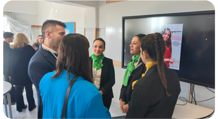
Producto final del Proyecto MIRA de Asistencia a la Dirección: "Networking, en clau de futur"